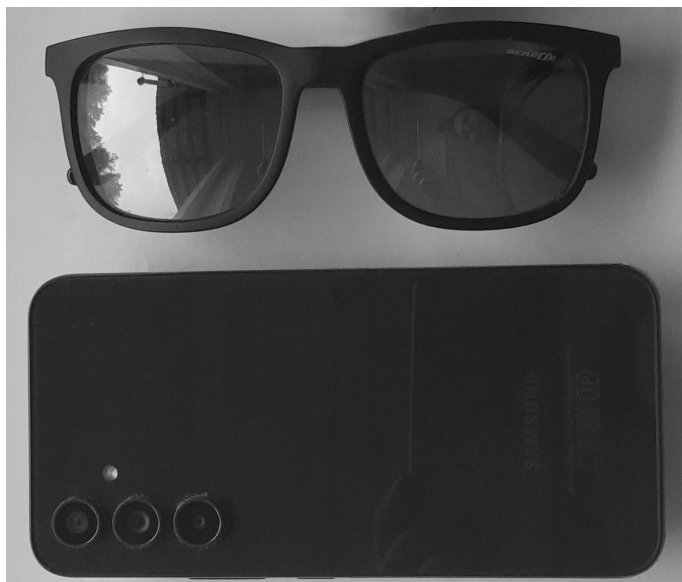
Рис. 2. Очки и смартфон рядом друг с другом.