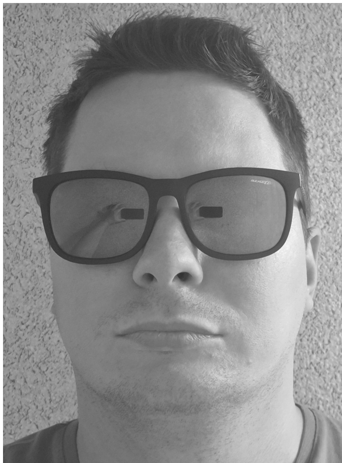
Рис. 1. Портретная фотография, сделанная с помощью смартфона.